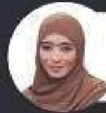
Diterbitkan oleh DJ MASLINA ALIAS